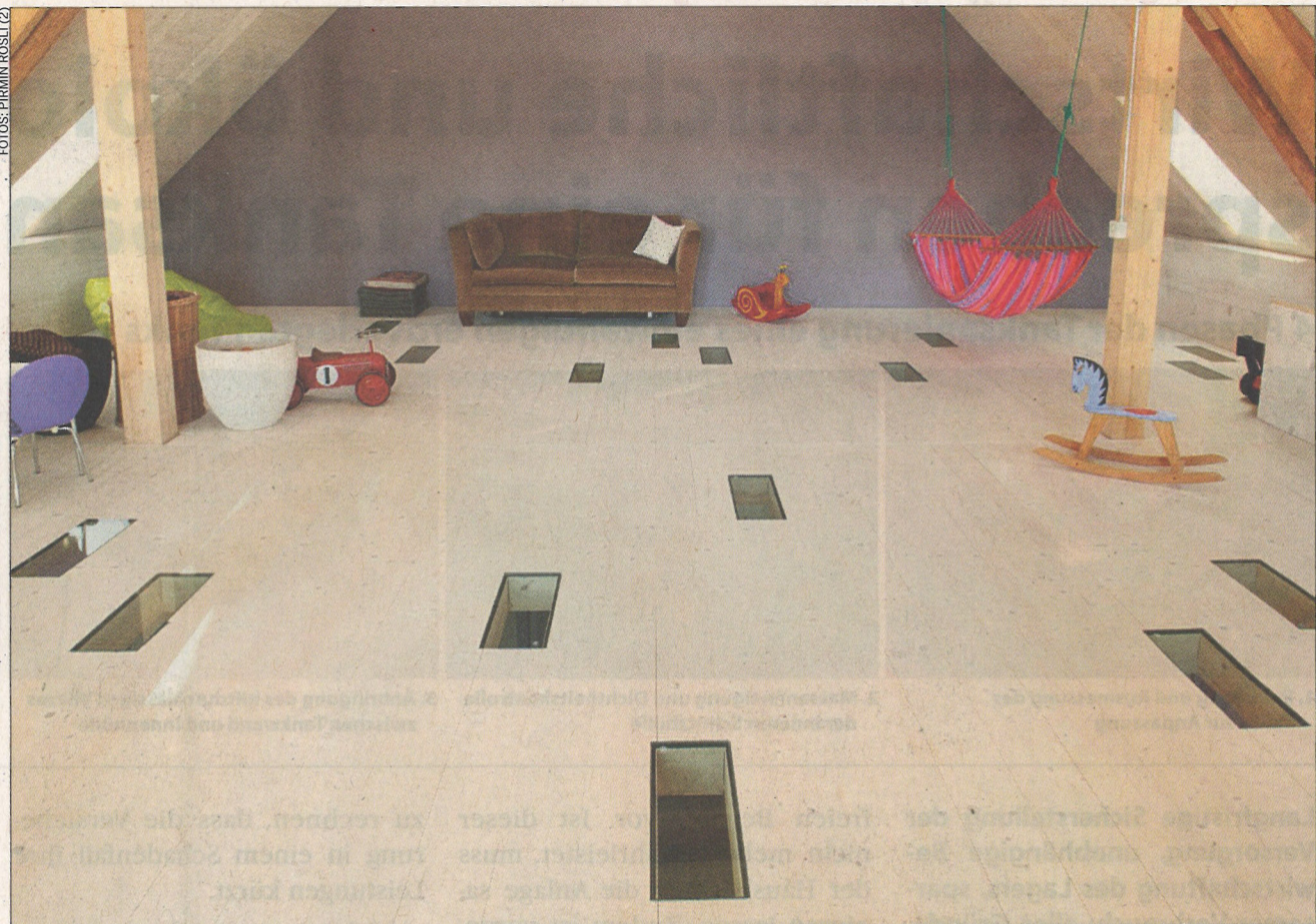
Im Dach der alten Scheune hat es Platz zum Verschwendung: Das neue Spielzimmer der drei Kinder mit Lichtnischen nach unten.

Und die Finanzen? Dank der Eigenleistung konnte der Traum für 750 000 Fr. umgesetzt werden. Dazu kommt der Kaufpreis für die Liegenschaft von 850 000 Fr. Dank den Mieteinnahmen aus den zwei Wohnungen ist die finanzielle Last für die Familie tragbar. Für die beiden «Stadtflüchtlinge» stimmt das Leben mit den Kindern auf dem Lande. Högger sagt mit Blick auf den blühenden alten Chriesibaum im Garten zum Schluss: «Das Volumen einer Scheune, hier mit Nebenräumen 520 m 2 , ist einfach toll. Und auch der Garten ist schon angelegt. Wo findet man so etwas heute noch?»