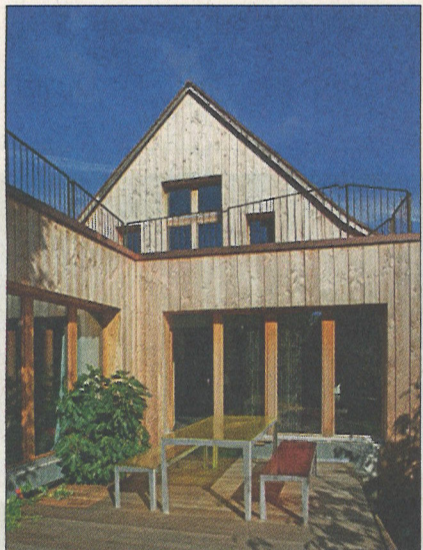
Anbau gegen Südwesten mit Terrasse.