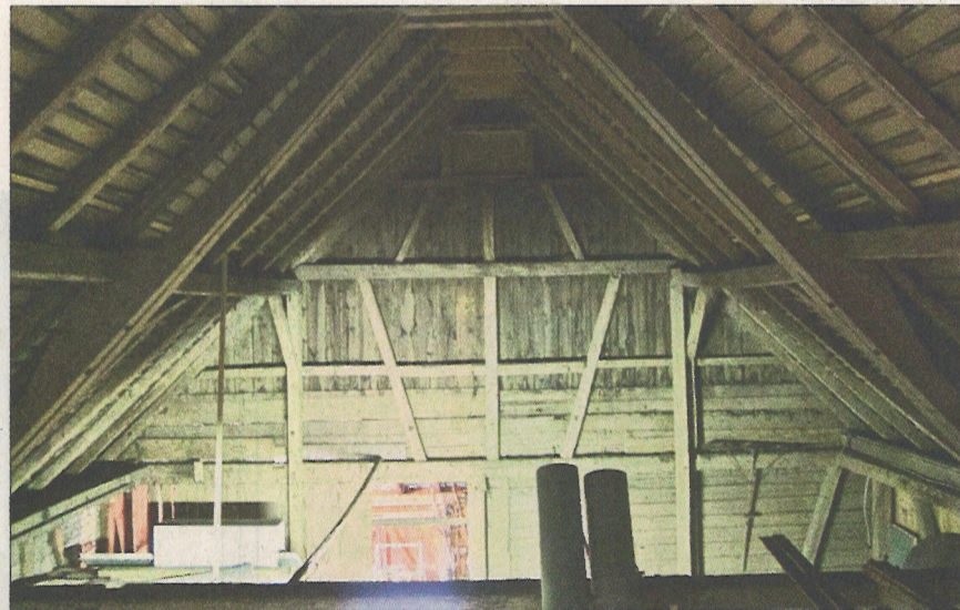
Die Scheune vor dem Umbau: 1470 m 3 Volumen, worin sich Träume realisieren lassen.